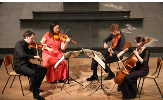
Varian Fry Quartett der Berliner Philharmoniker

Die Details zu allen Konzerten und Solisten entnehmen Sie bitte unserer Website www.fk-kibou.org